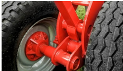
Traba en transporte.