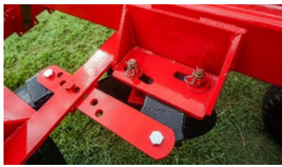
Sist. de registro de ángulo de ataque de bandejas (interno).