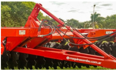
Registro de regulación lanza y chasis.