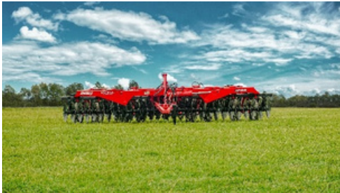
Rastra en posición de trabajo.