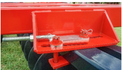
Sist. de registro de ángulo de ataque de bandejas (externo).