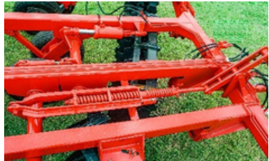
Sist. de regulación de inclinación de chasis.