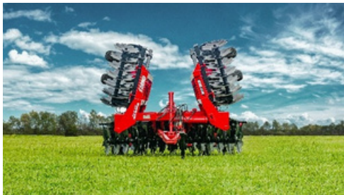
Rastra en posición de transporte.