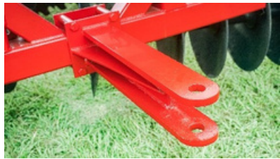
Enganche trasero de serie.