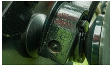
Bajada y caja de fundición.